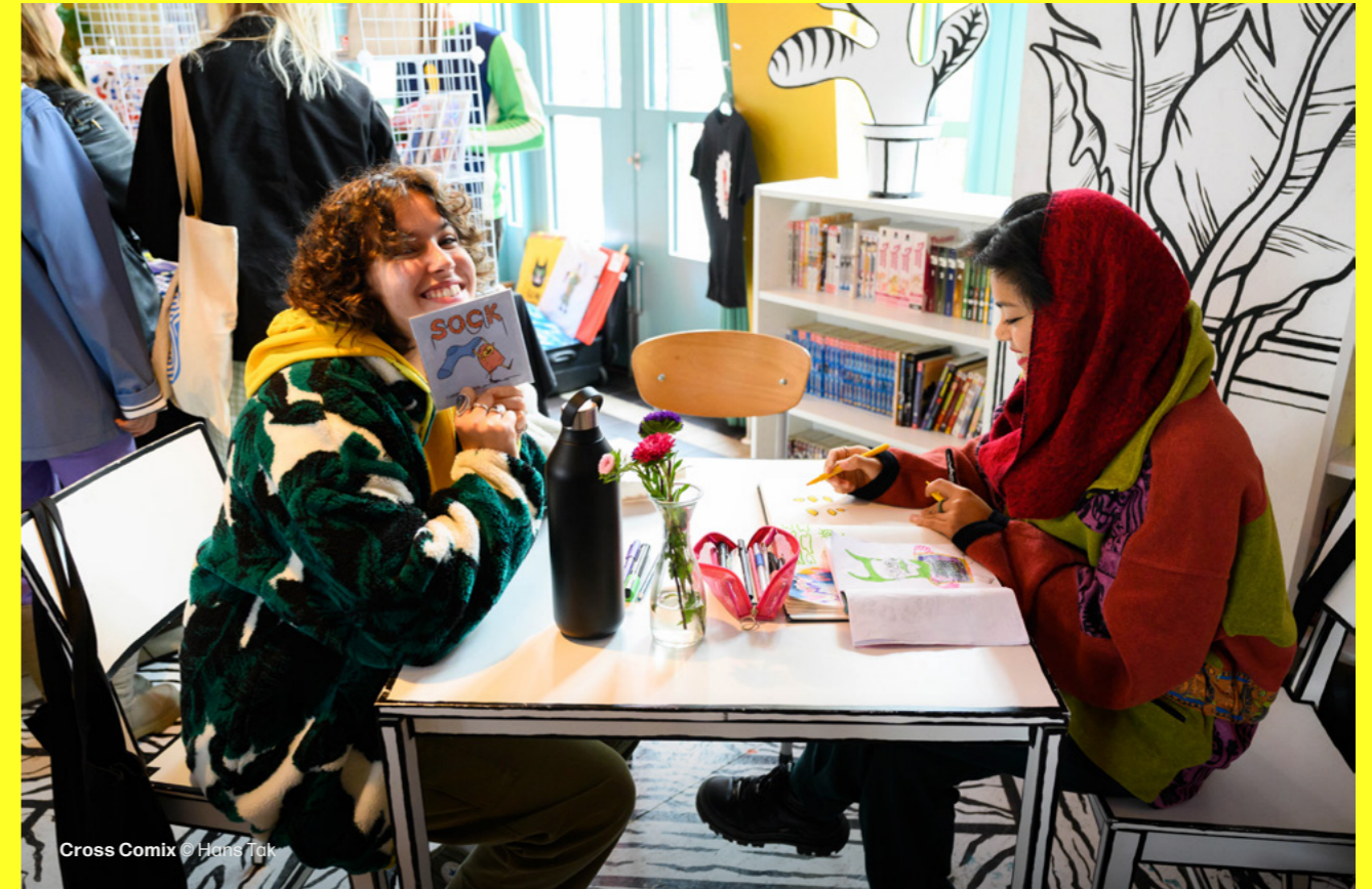
Cross Comix © Hens Tak

Ons Culturele Doelgroepenmodel wordt op de volgende plekken gebruikt: