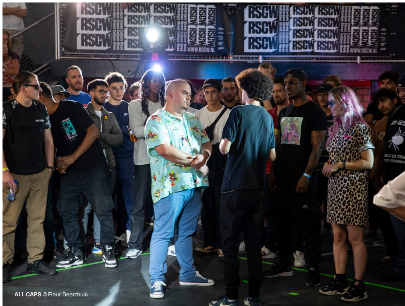
ALL CAPS

*De Net Promoter Score (NPS -100 tot 100) is een belangrijke KPI voor klanttevredenheid en klantloyaliteit. Hoe hoger deze score, hoe meer tevreden en loyaal bezoekers zijn. Centraal staat de vraag hoe waarschijnlijk het is dat bezoekers het festival zouden aanbevelen aan anderen.