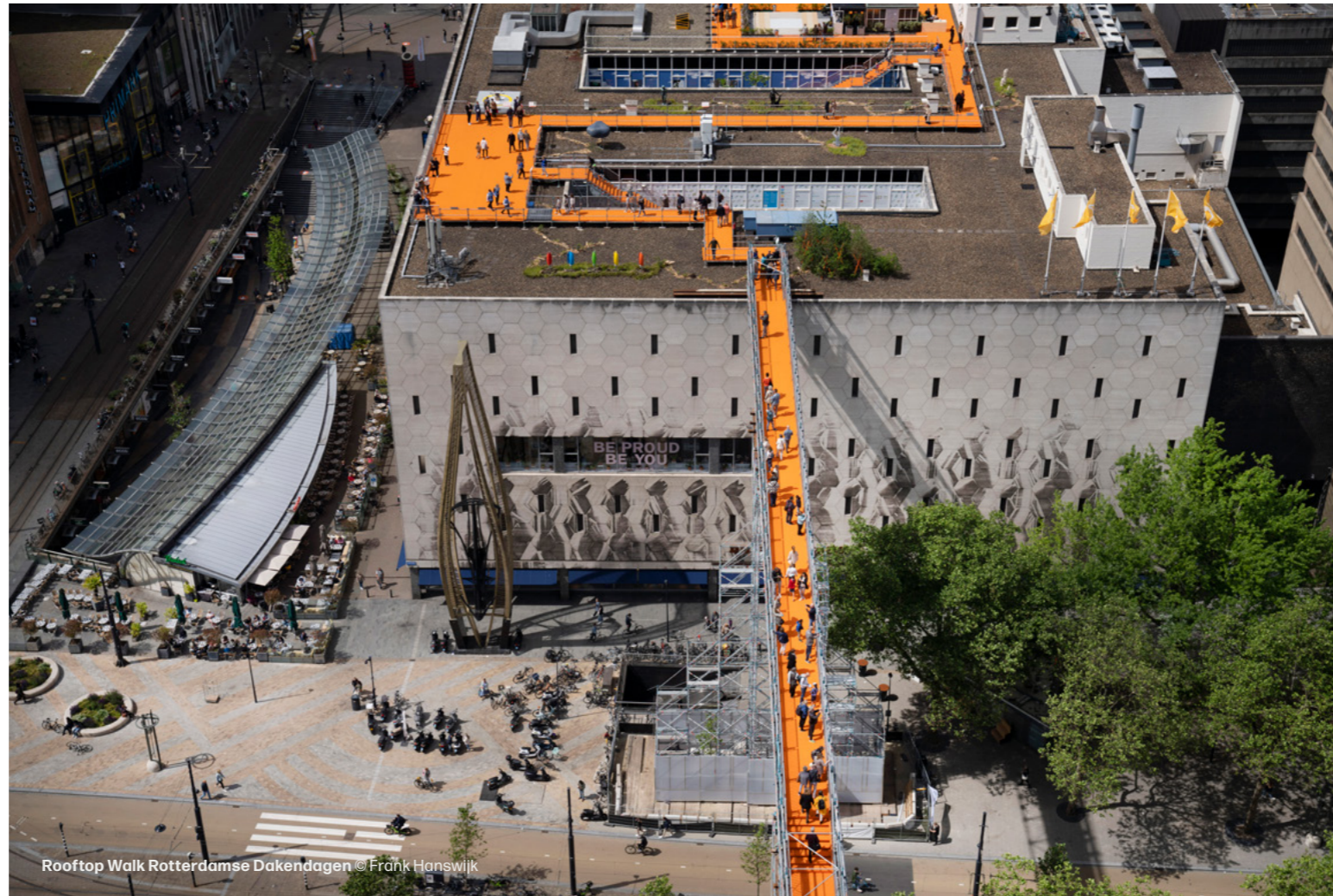
Rooftop Walk Rotterdamse Dakendagen