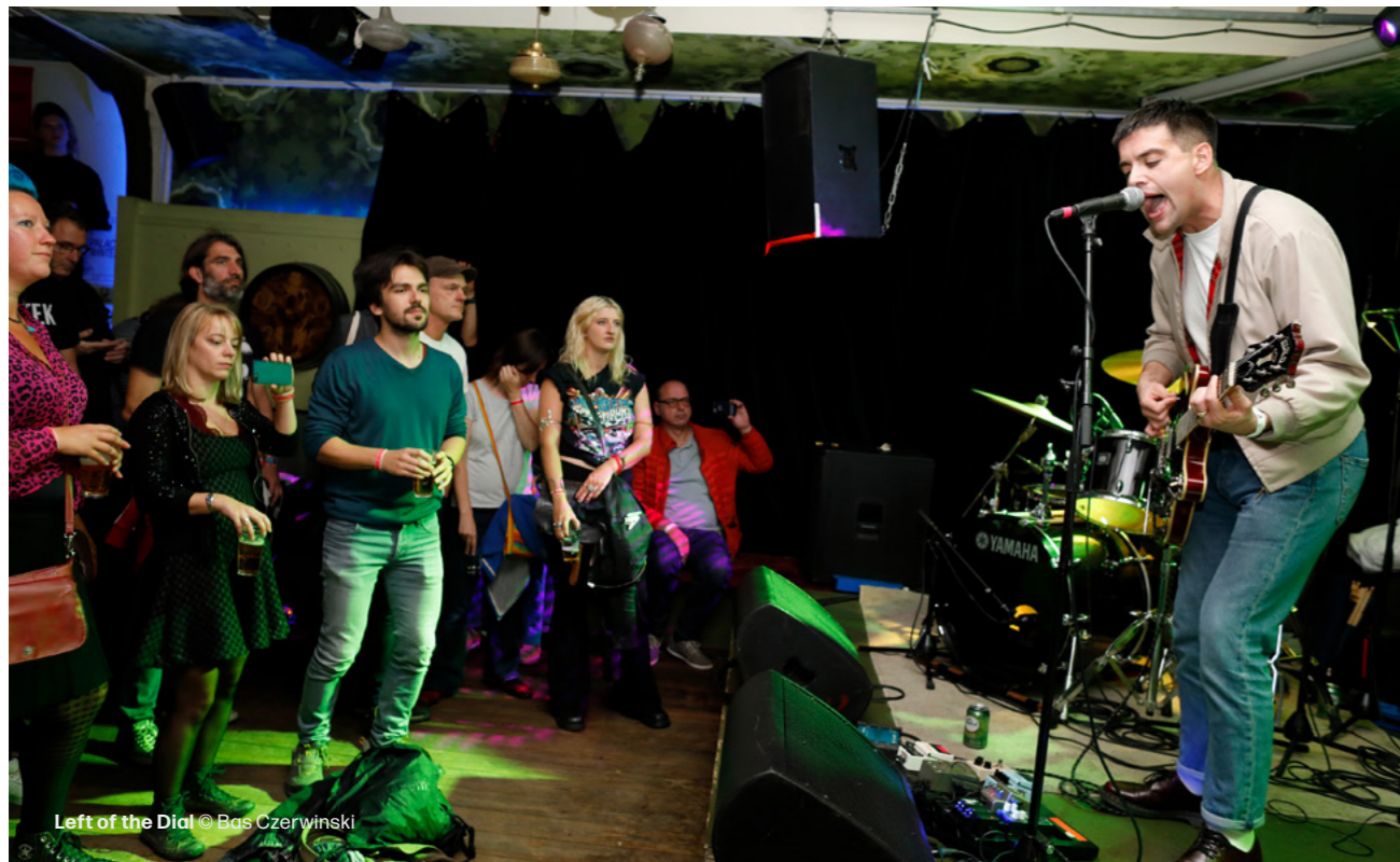
Left of the Dial

Uiteraard geldt dat evenementensuccessen uitlichten het gevaar met zich meebrengt dat we andere evenementen automatisch als niet succesvol bestempelen. Dat is allerminst het geval geweest in 2022. Toch willen we een aantal evenementen onder de aandacht brengen waar bijzondere stappen zijn gezet.