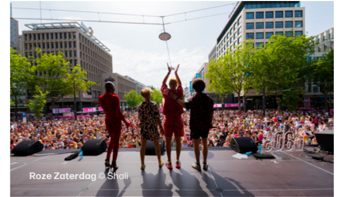
Roze Zaterdag

Een succes het afgelopen jaar was de Rotterdam Rooftop Walk, georganiseerd door de Rotterdamse Dakendagen. Met een groot gebaar in de buitenruimte – een stelling hoog over de Coolsingel en een tour over de daken – werd aandacht gevraagd voor de potentie die het dakoppervlak een stad biedt, bijvoorbeeld in het tegengaan van hittestress, het opwekken van energie en opvangen van regenwater. Maatschappelijke kwesties, duurzaamheid en cultuur gingen bij dit event hand