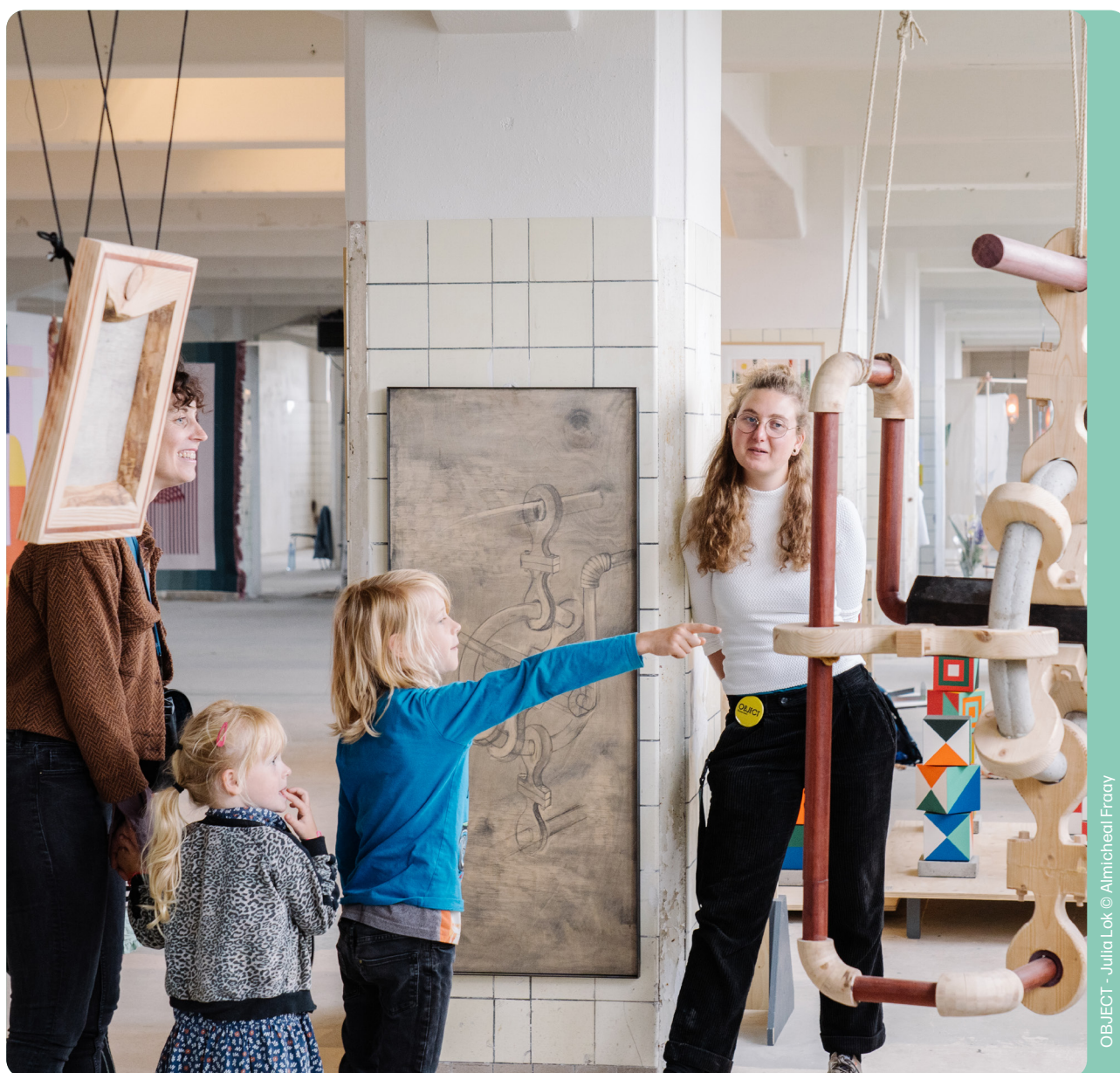
OBJECT - Julia Lok © Almiechel Fraay

Wij vertellen wat er te doen is in ons magazine, de speciale kidseditie van het magazine, onze online agenda en artikelen op onze website, in thema nieuwsbrieven en op onze social media.