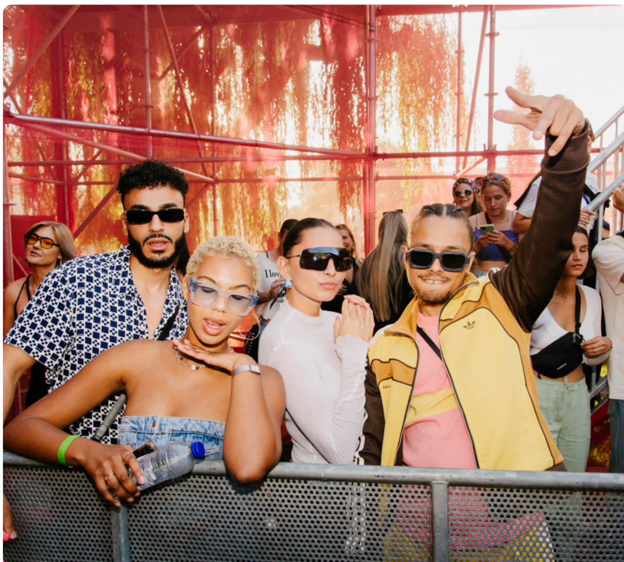
Blijdorp Festival 2022

*Zie bereikcijfers onder betreffende campagnes