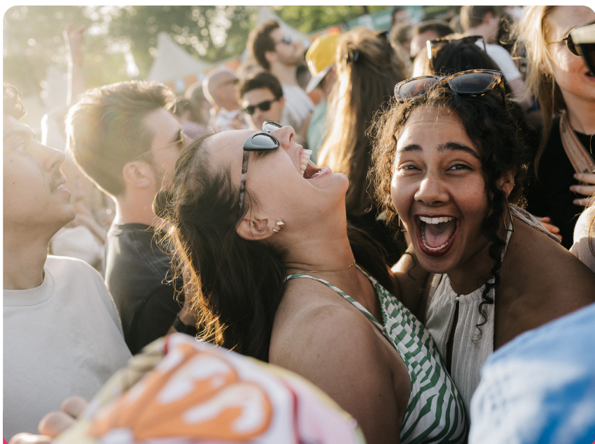
Blijdorp Festival