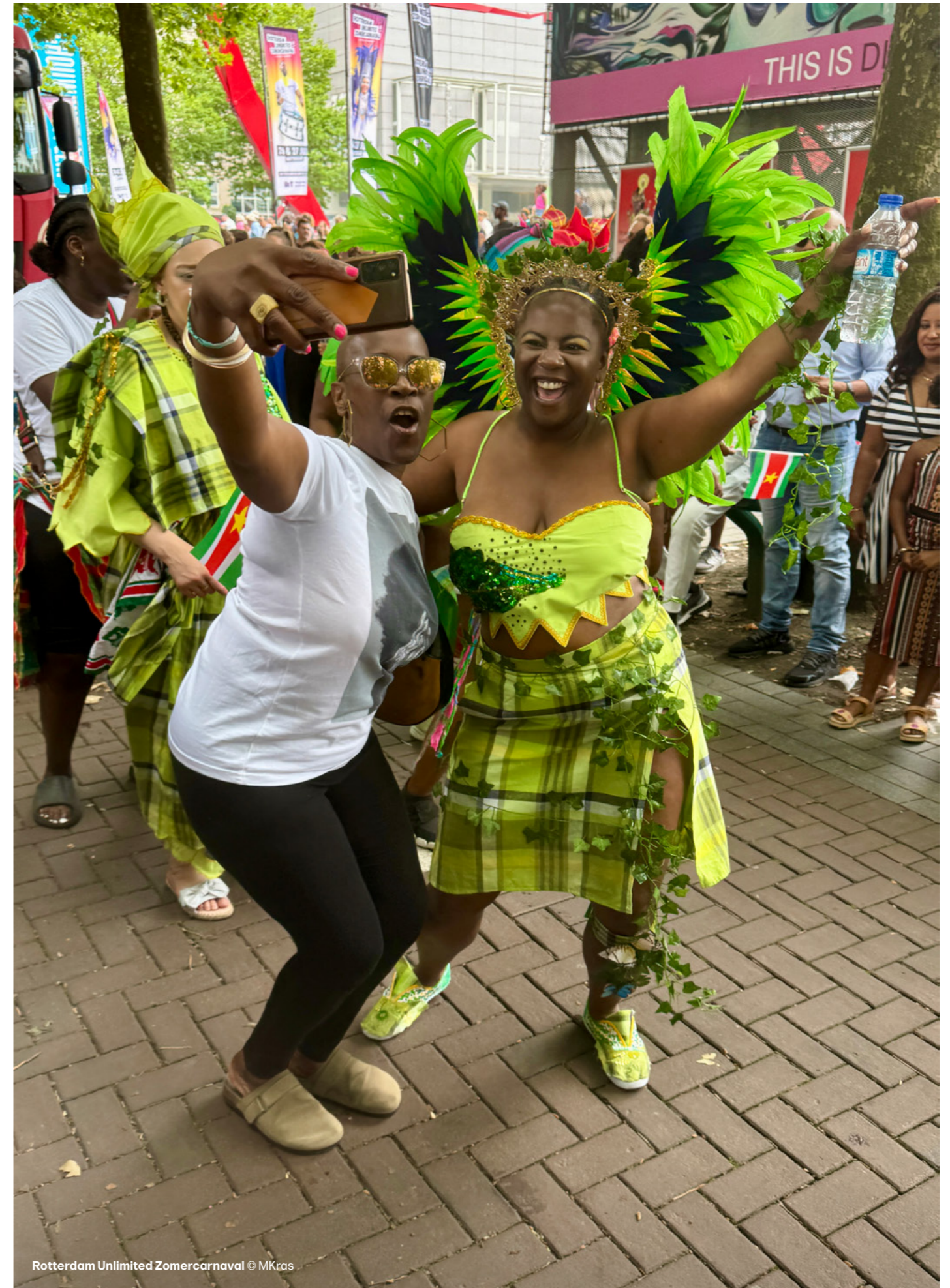
Rotterdam Unlimited Zomercarnaval

Een van de belangrijkste conclusies uit het onderzoek is dan ook dat het (potentiële) publiek graag een terugkeer van dit programma op vrijdagavond op de Coolsingel ziet. Deze bevindingen uit het onderzoek hebben we gebruikt als onderbouwing voor ons advies aan de gemeente Rotterdam over het B/C-evenementenoverzicht.