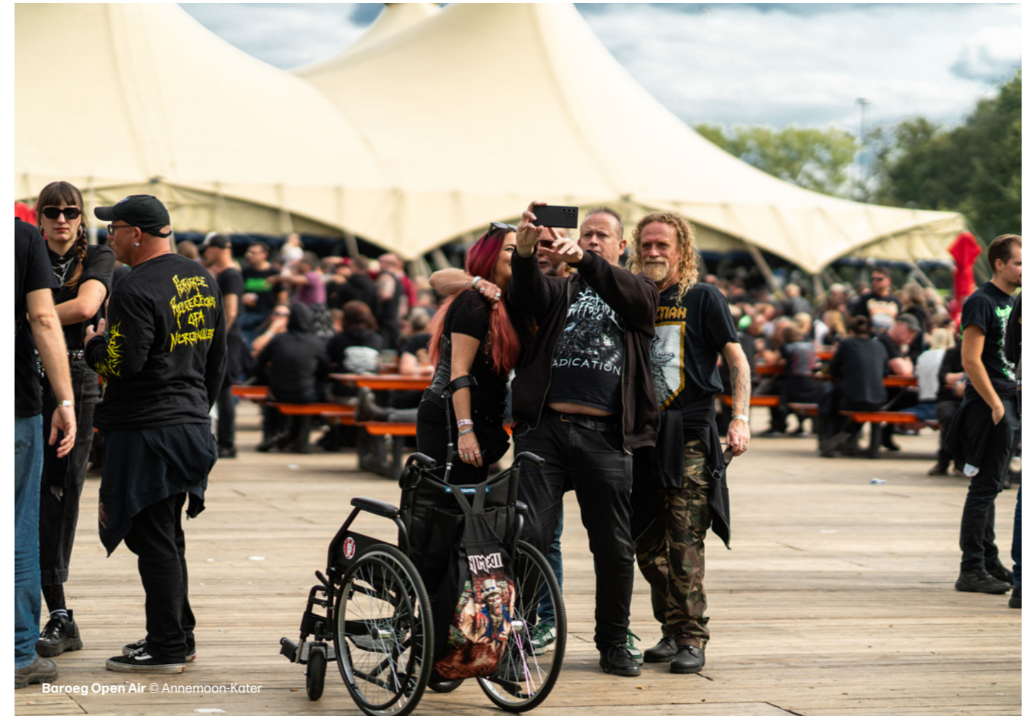
Baroeg Open Air

De eisen waaraan festivalorganisatoren moeten voldoen in Rotterdam zijn steeds hoger geworden. Vooral jonge makers ervaren drempels. En juist jonge makers zijn zo belangrijk voor de culturele vernieuwing in de stad. Door ze te helpen hun weg te vinden in (gemeentelijke) regelgeving en