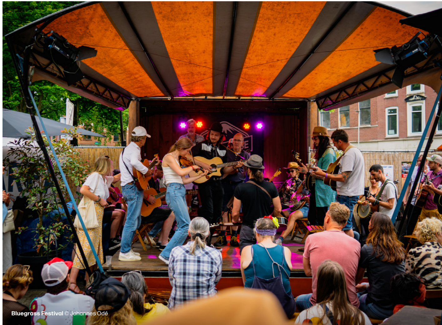
Bluegrass Festival