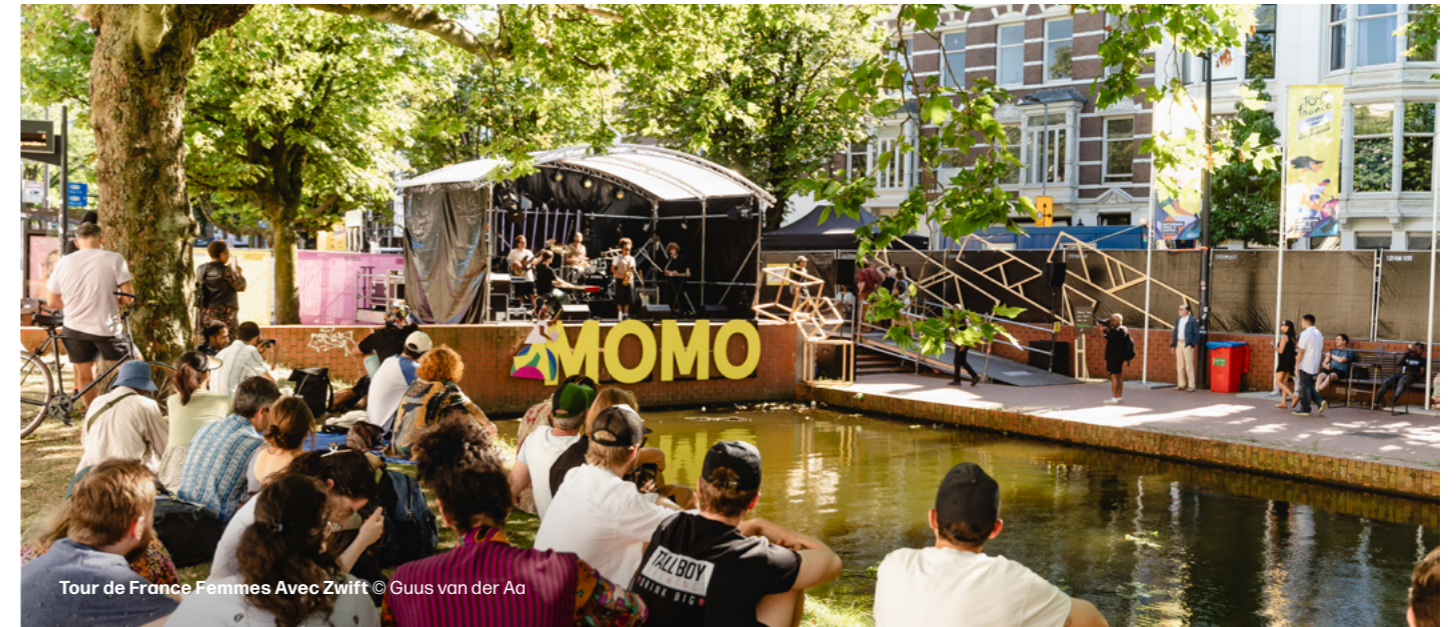
Tour de France Femmes Avec Zwift

Ook het fietsgerelateerde stadsprogramma werd goed bezocht. Bezoekers gingen onder andere met Stichting Give a Bike in gesprek over gendernormen, fietsmythes en ideale fietsmuziek. Op de expositie Tour de Freedom leerden geïnteresseerden uitgebreid over de geschiedenis van het vrouwelijke fietsen.