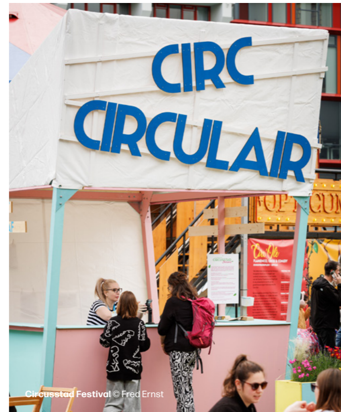
Circusstad Festival

Jaarlijks stelt Rotterdam Festivals het B/C-evenementenoverzicht van Rotterdam samen. Dat doen we in samenwerking met Directie Veiligheid, de afdeling Cultuur en de betrokken diensten, waarna het College van B&W een besluit hierover neemt. Het samenstellen van de evenementenkalender voor 2025 was een grotere uitdaging dan normaal. Belangrijkste oorzaak hiervoor is de NAVO-top die in juni 2025 plaatsvindt in Den Haag. De politie-inzet die daar nodig is, is enorm en gaat ten koste van de capaciteit in de rest van het land. Dat heeft ook gevolgen voor de programmering van cultuur in onze stad. Rotterdam Festivals is er trots op dat het, dankzij de goede samenwerking met gemeente Rotterdam en diensten, zoals de politie, de veiligheidsregio en de RET, toch gelukt is om bijna alle evenementen een plek te geven op de kalender. Het betekent wel dat een aantal festivals op andere data plaatsvinden dan we gewend zijn.