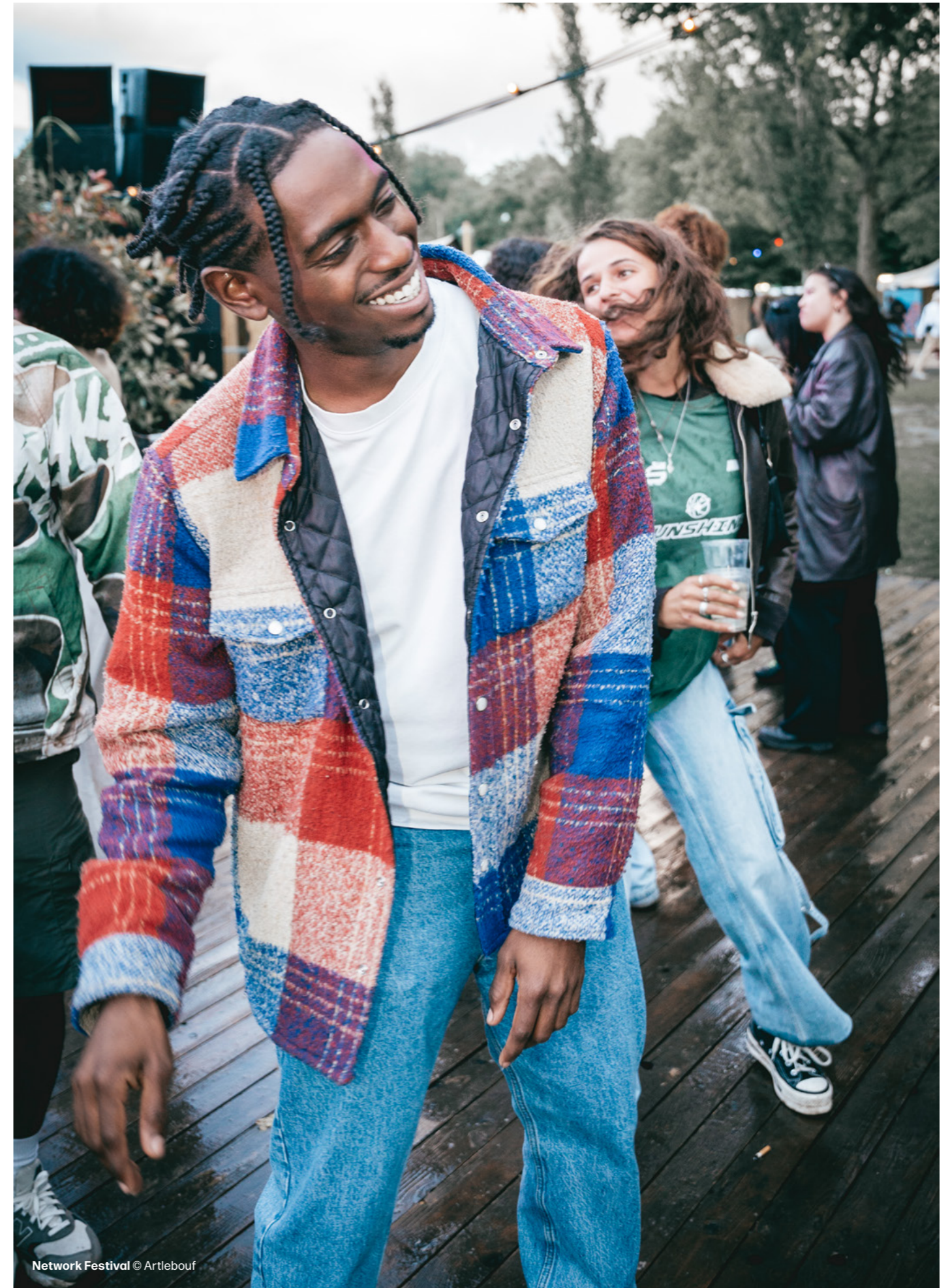
Network Festival

Bezoekersaantallen worden aangeleverd door de culturele instellingen en festivalorganisatoren.