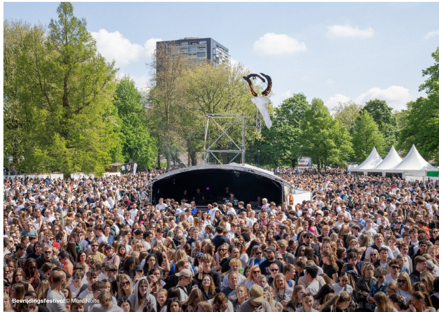
Bevrijdingsfestival © Marc Nolte