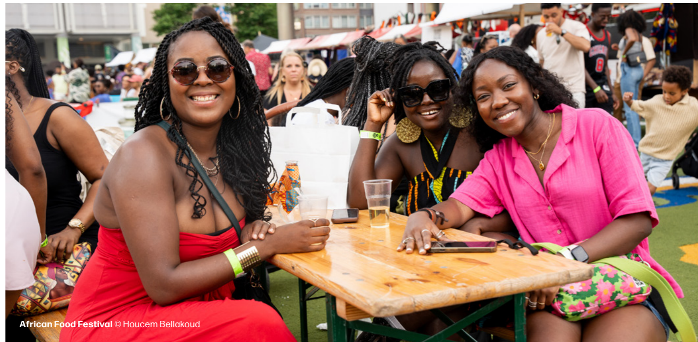
African Food Festival

Tijdens de Rotterdam Architectuurmaand werd, in samenwerking met ZigZagCity, een crossover gemaakt tussen stedelijke ontwikkeling, beeldende kunst, architectuur en heden, verleden en toekomst van het Museumpark. Een hoogtepunt was Snakken naar Boijmans, waarmee Museum Boijmans van Beuningen met een tijdelijke openstelling en tentoonstelling het 175-jarig jubileum met het publiek kon vieren.