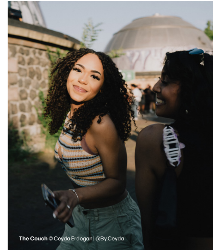
The Couch