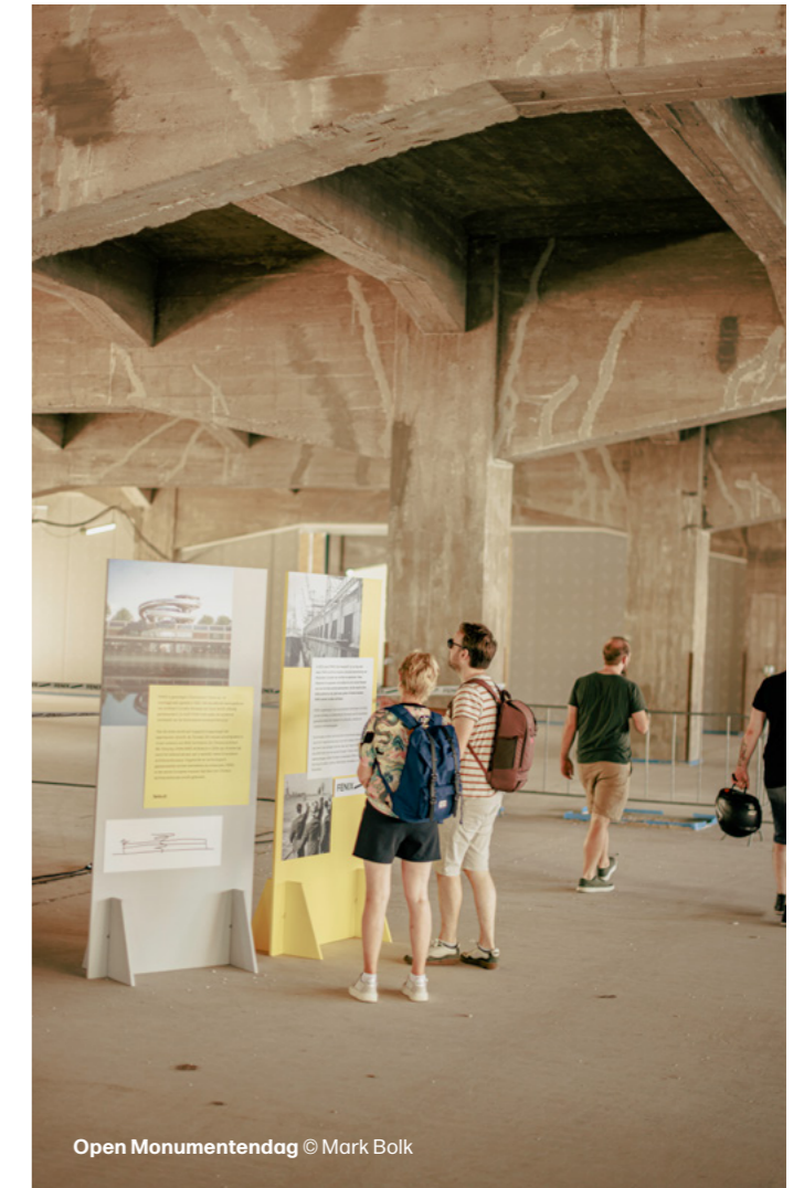
Open Monumentendag

De Culturele Doelgroepen zijn veel meer gaan leven. We hebben nu een goed beeld van de groepen; ook de verschillen zijn heel duidelijk.